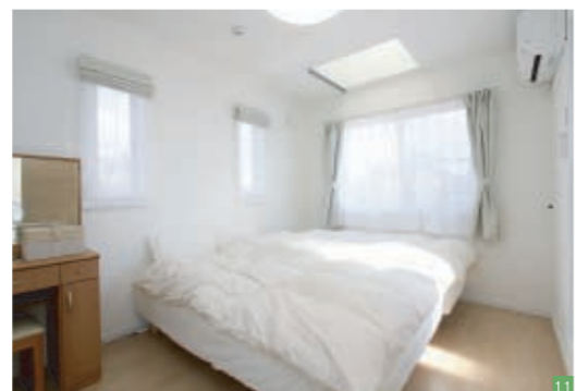
10 扉を斜めに切ることで空間を広く見せる玄関 11 天窓から光が降り注ぎ、夜は星空やお月さまが見えるロマンチックな寝室

設計・施工 ▶ 丸昇彦坂建設 竣工 ▶ 2017年3月 構造・工法 ▶ 2×4工法(枠組壁工法) 敷地面積 ▶ 161.15㎡ [48.75坪] 延床面積 ▶ 101.04㎡ [30.62坪] (1階 57.97㎡、2階 43.07㎡) 施工期間 ▶ 4か月