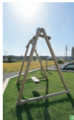
4 庭の鉄棒とブランコはご主人のハンドメイド。鉄棒はこどもの成長に合わせて高さが変えられるのも、おもしろい