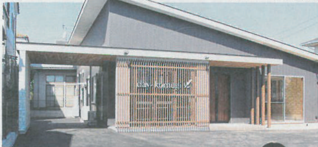
カフェを思わせるような外観